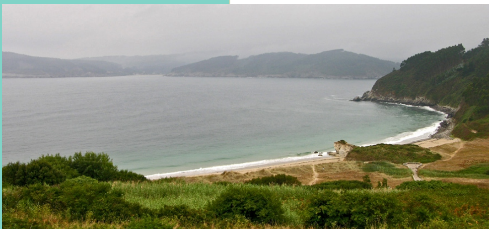
Praia de Bares