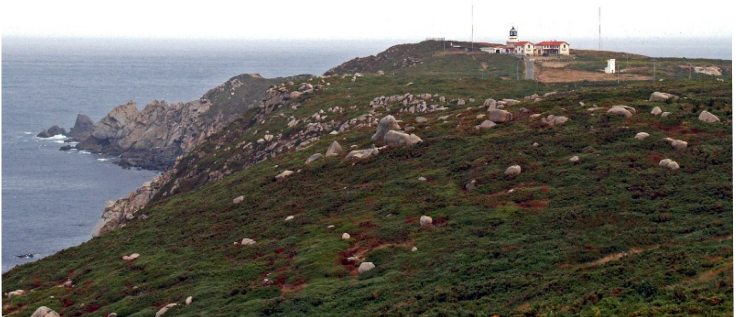
Punta de Bares e faro.