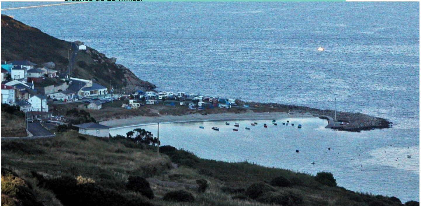
Porto e Coído de Bares