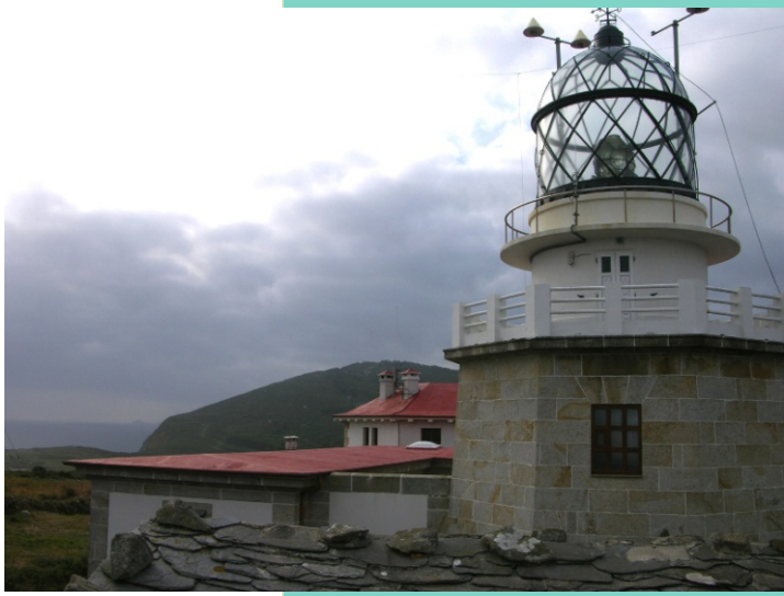
Faro de Estaca de Bares, construído en 1850. Ten un alcance de 25 millas.