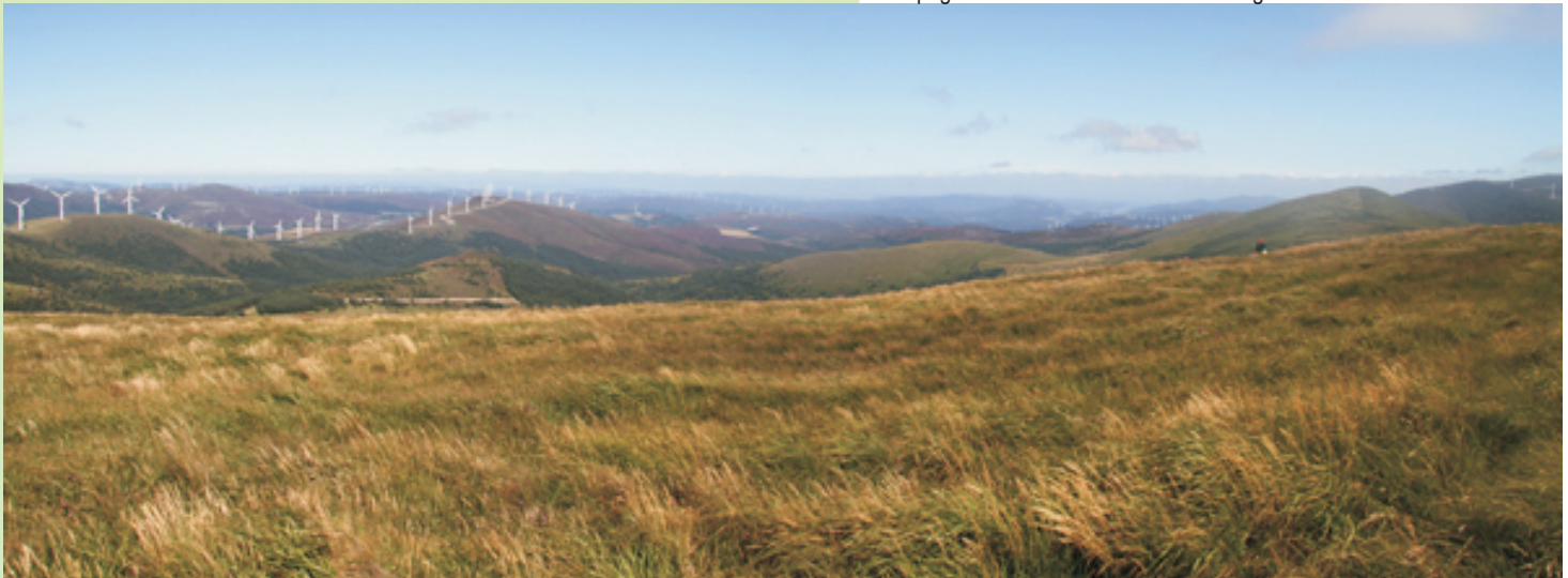
Vista cara ao norte desde As Barreiras do Lago