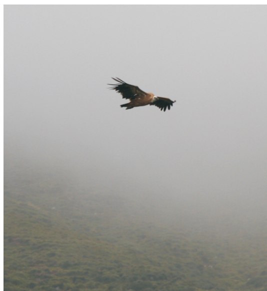
Voitre, unha visita inesperada