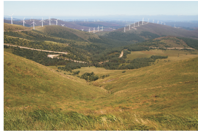
O Apagadoiro desde As Barreiras do Lago