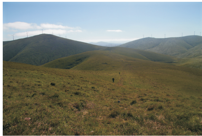
Baixando das Barreiras do Lago cara ao Cadramón