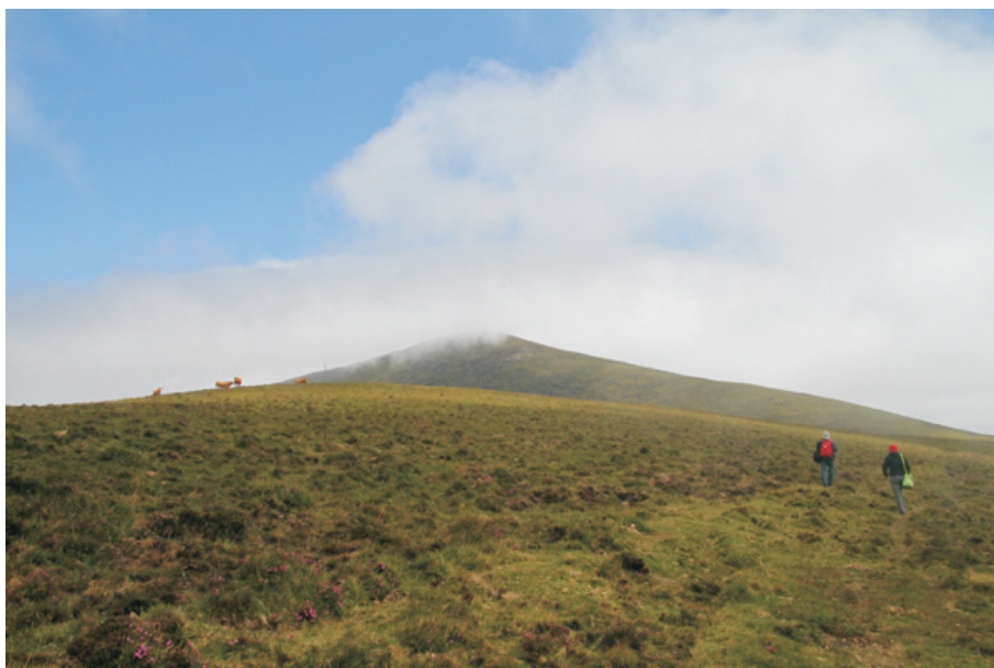
De volta polo Seixo Branco. Ao fondo unha das ameazas da ruta, a néboa sobre o cume do Cadramón