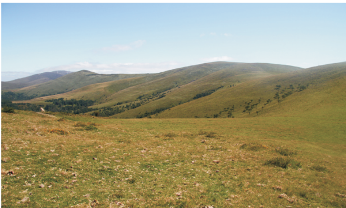
O camiño feito e o camiño de volta. O Cadramón desde o Xistral.