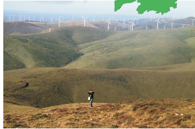
Baixando no Cadramón

A volta facémola polo mesmo camiño que remata coa subida pola forte pendente que leva ao cumo do Cadramón (algo máis de 600 m cun desnivel por enriba do 20%).