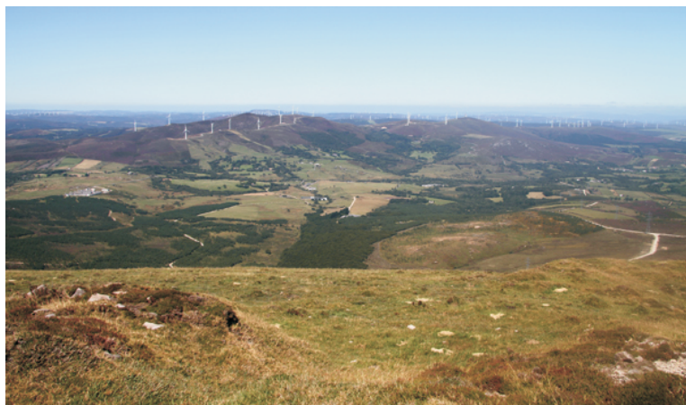
Vista desde o Xistral sobre o val de Viveiró