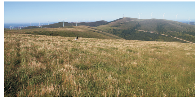
Barreiras do Lago. Ao fondo o Xistral.