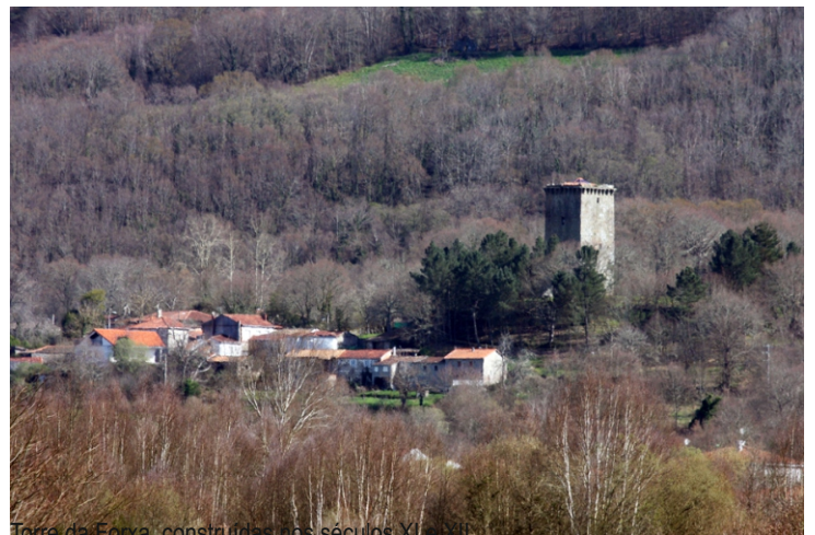
Torre da Forxa, construídas nos séculos XI e XII, que formaba parte dunha serie de fortificacións