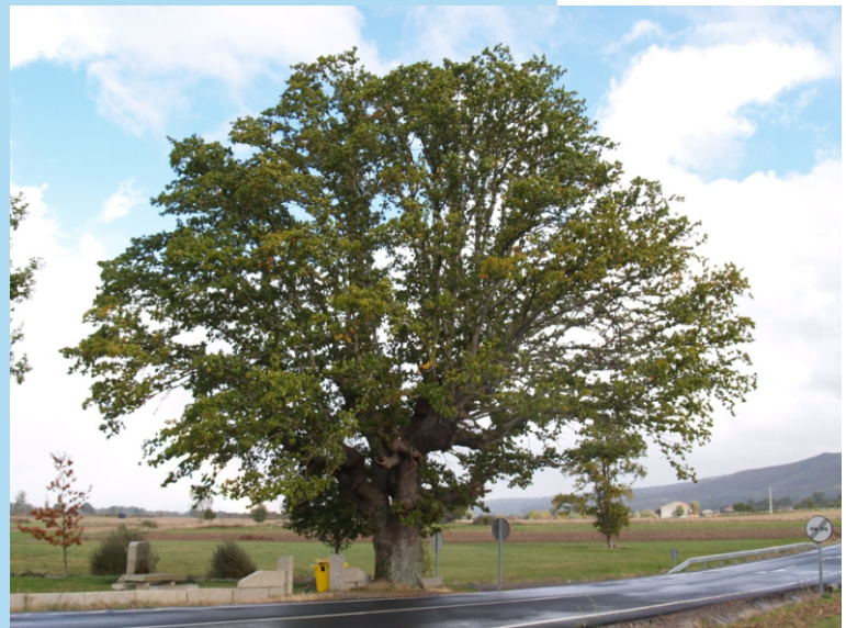
Carballo das Lamas. -5,23 m de perímetro. Atópase ao pé da Estrada Xinzo-Bande, despois de pasar A Forxa, á dereita.