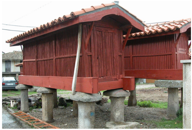
Eira de hórreos na praza principal da Forxa (Praza da Aira), capital municipal da Porqueira.