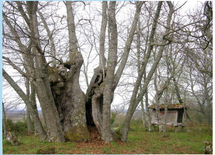
Castiñeiro de A Forxa. -8,30 m de perímetro (oito ponlas). Na parte alta da localidade, no camiño que sobe á fervenza.