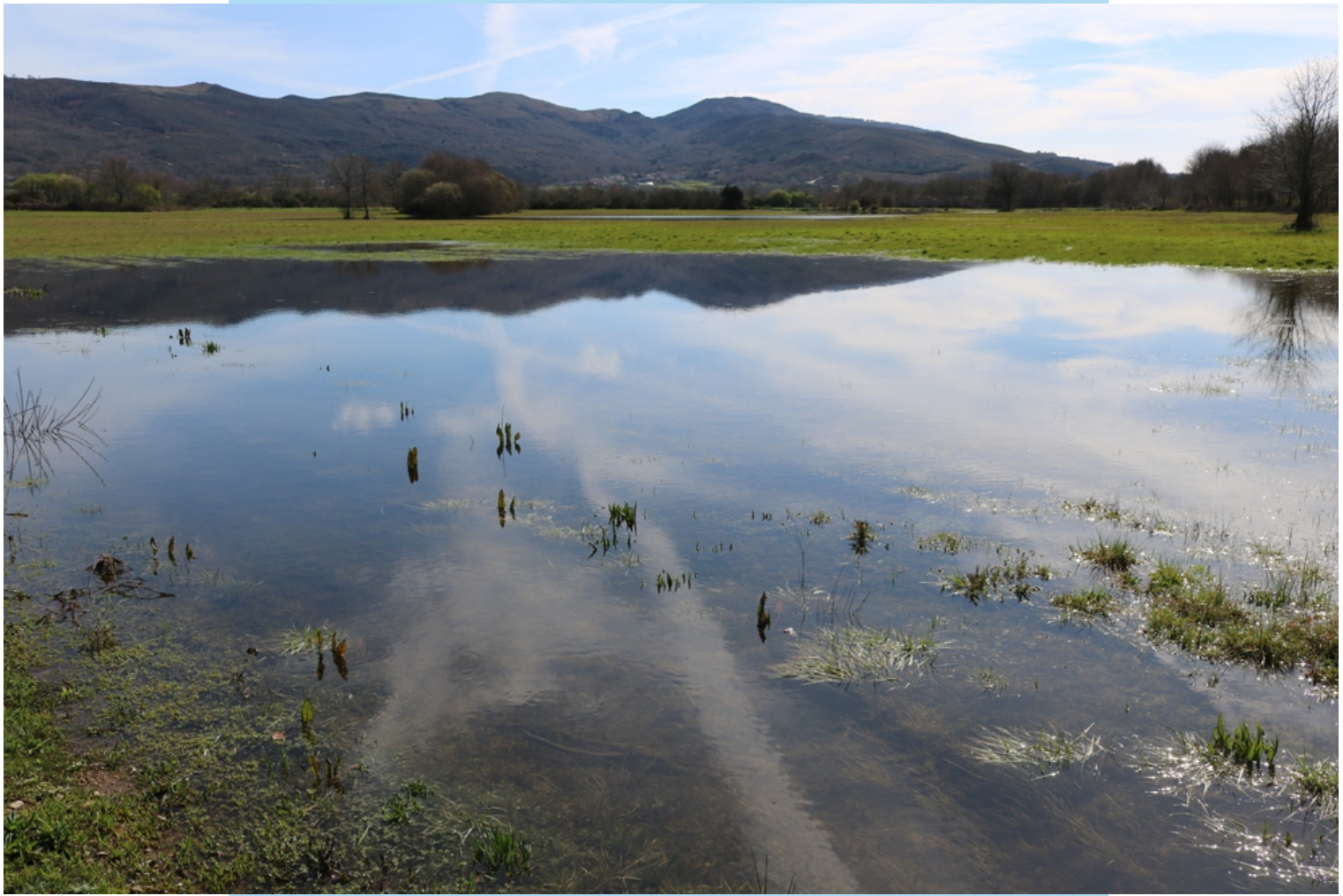
Veigas da Porqueira