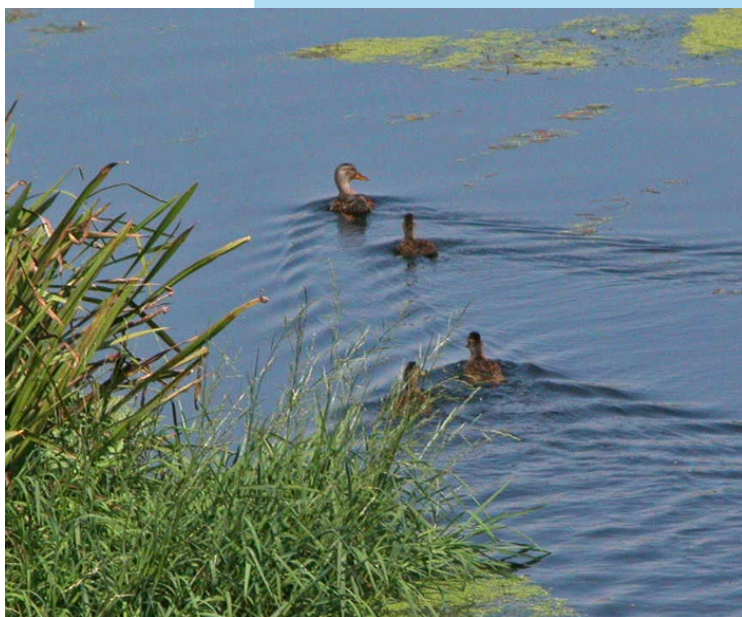
Lavanco no Limia

É unha pequena área nas veigas do río Limia nos concellos da Porqueira e Rairiz de Veiga. Atópanse ao pasar a confluencia da canle de desecación do Limia e o río. Son extensos pasteiros asolagados no inverno rodeados de vexetación de ribeira. Na actualidade están ameazadas tamén polas explotacións agrícolas e a contaminación por adubos. Fora do espazo protexido están as Veigas da Porqueira. A vexetación da zona é a típica das áreas húmidas. Nos límites da área aparecen pequenos bosques de salgueiros, amieiras, freixos e carballos. Nos prados que se asolagan, nas beiras da auga e no río hai xuncos, espadanas, lirios amarelos, ambroíños, ranúnculos, oucas, lentellas de auga, pe de boi ... A maior importancia reside na gran variedade e cantidade de aves acuáticas e terrestres. Destaca a presenza do sisón, a tartarafa cinsenta e o pernileiro.