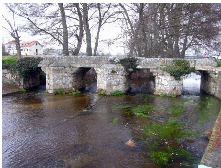
Ponte medieval sobre o Fíveda na Forxa

Propoñemos unha visita para coñecer algúns dos lugares de maior interese nun percorrido que podemos facer en coche, con pequenas camiñadas, en bicicleta, ou cunha ruta circular a pé. As mellores datas para ir poden ser a finais do inverno, na primavera ou no outono para gozar mellor das paisaxes onde a auga é unha importante protagonista, e a biodiversidade está máis presente.