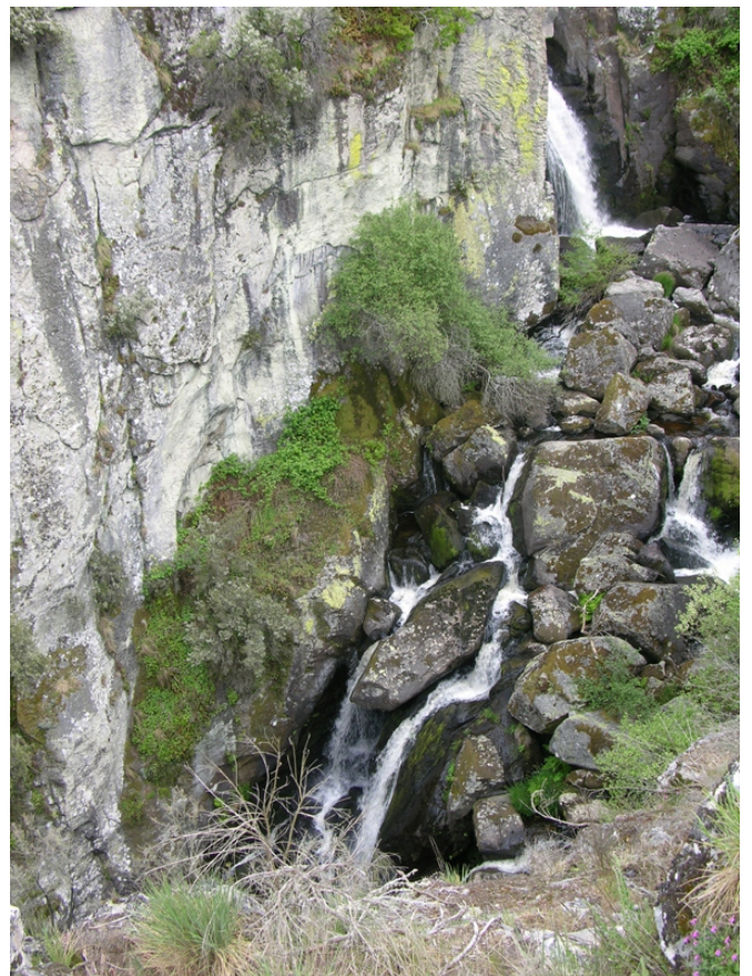
Salto no río Fírveda