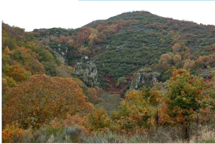
Fraga nas abruptas ladeiras do val do Fíveda Nas beiras do río desenvólvese un bosque de ribeira formado por ameneiros, freixos, bidueiros... cun sotobosque rico en fentos, brións, hepáticas e outras plantas de zonas húmidas. Nos arredores hai carballos e rebolos e soutos con grandes castiñeiros.