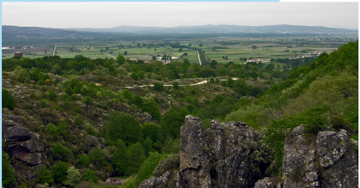
Río Fíveda na Limia