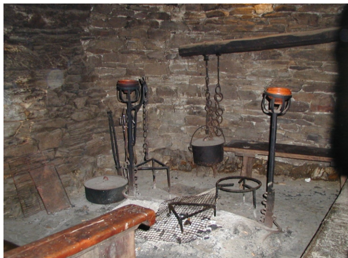
Interior dunha palloza. Cebreiro