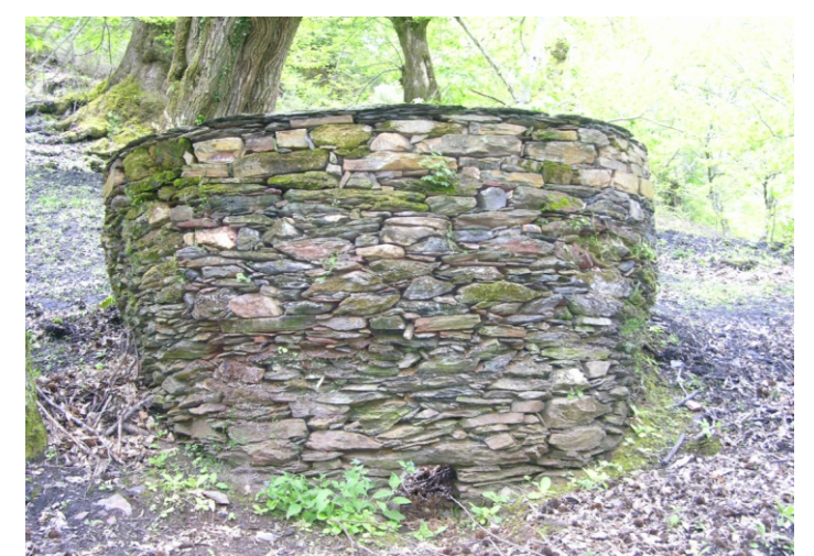
Forno de cal. Cereixido. Quiroga.