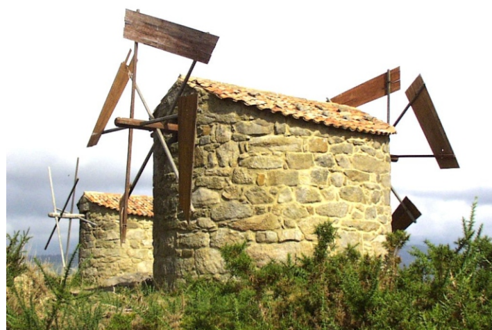
Muíño de vento. Abalo. Catoira.