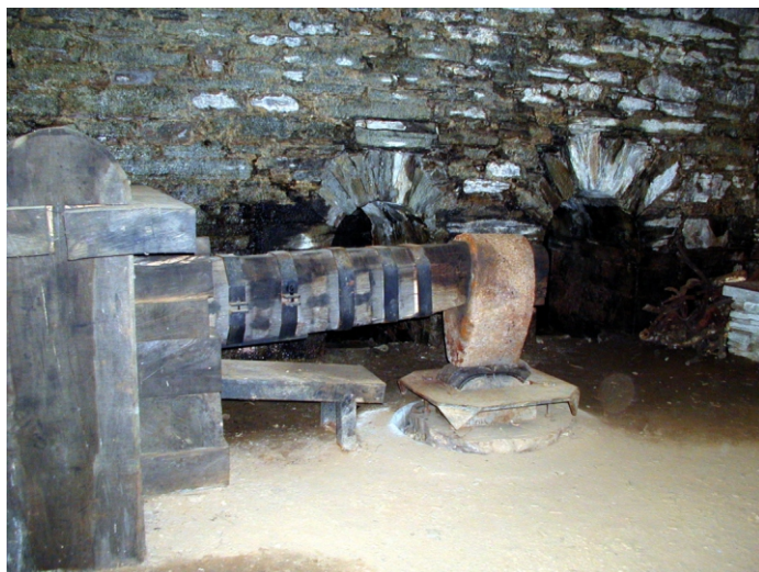
Mazo da ferrería de Penacova. Bóveda.