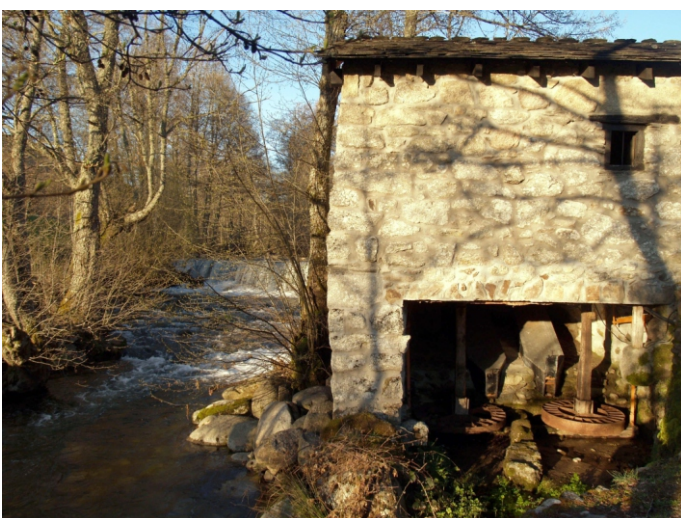
Muíño no río Xares. A Veiga