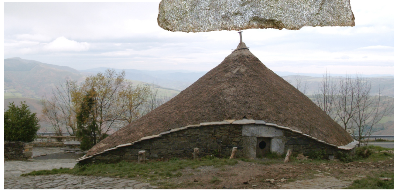
Palloza. O Cebreiro