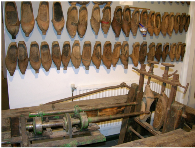
Museo etnográfico. A Fonsagrada