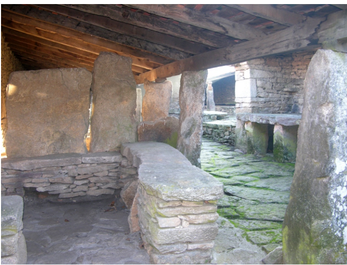
Pendellos da feira de A Golada.