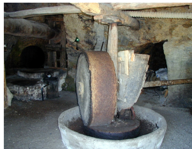
Muíño de Aceite. Bendilló. Quiroga.