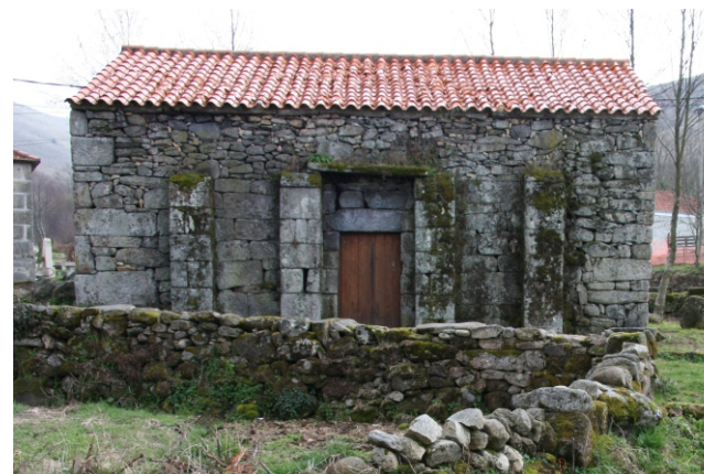
Forno comunal. Rubiá dos Mistos