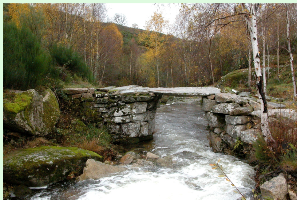
Pontella no río Casteligo. Chandrexa de Queixa.