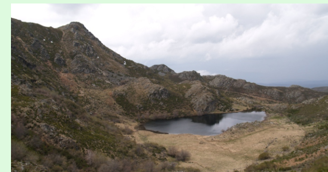
Lagoa do Ocelo ao pé do Sestil, na Serra Calva.