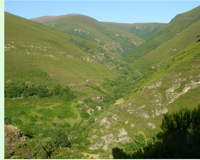
Fragas no rego de Montouto, entre as serras dos Cabalos e do Cabreiro. No rego de Montouto e os seus afluentes hai varias fervezas e na parte baixa consérvanse os restos da ferrería do Mazo.

O punto máis alto é o Pico Montouto, con 1.524 m na confluencia das provincias de Ourense, Lugo e León. Pódese acceder desde A Seara por unha pista de terra ou desde Outeiro a pé.