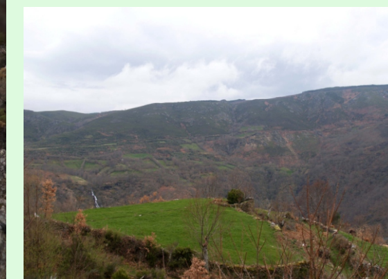
Vista norte da serra do Canizo.