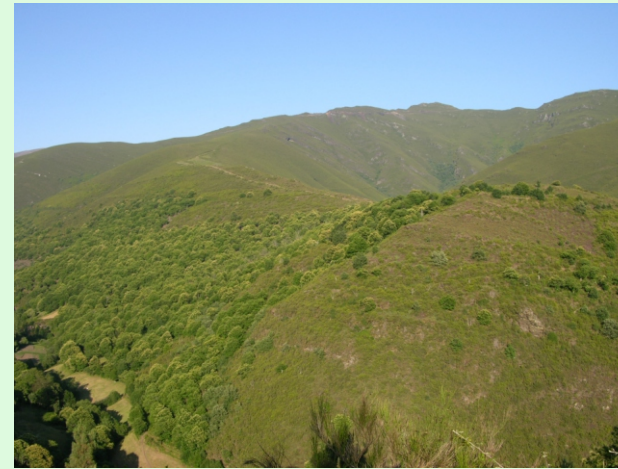
Souto de Outeiro na aba oeste da serra.

A máxima altura é o alto do Cabreiro, con 1.388 m. Dos seus cumes baixan varios regos afluentes do Soldón. O do Caroceiro forma unha pincheira de máis de 40 m de caída, que só se pode ver na época de chuvias. Accedese desde Vilarmel ou Outeiro, por unha rota a pé.