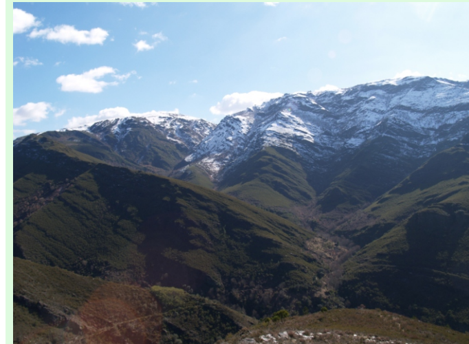
Caborco do Fiais, afluente do Soldón.

A máxima altura é o Lagoa Grande, con 1.246 m. Ten gran interese etnográfico: albarizas, fornos de cal, restos de ferrerías, sequeiros, muíños... Accedese desde Bendollo ou desde Rugando.