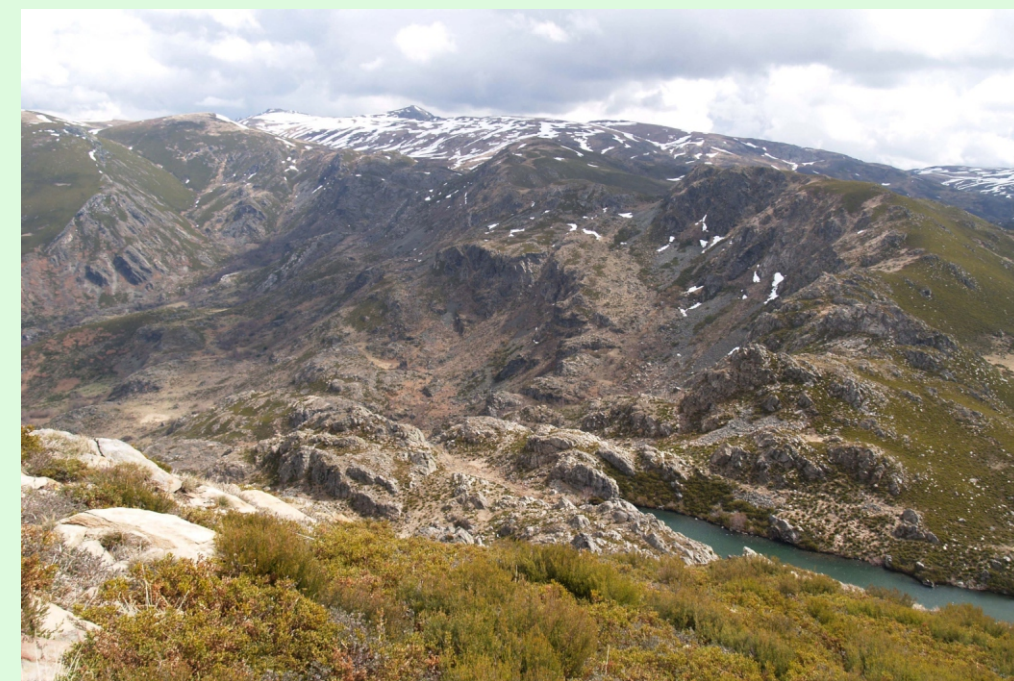
Lagoa da serpe, entre as serras Calva e do Eixe. Ao fondo Pena Trevinca.

Accedese desde A Gudiña ou Viana do Bolo.