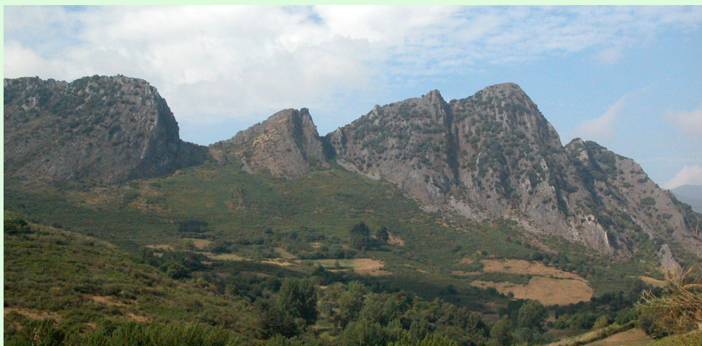
Penedos do Oulego.