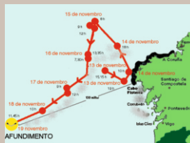
A viaxe do "Prestige" desde o accidente ata o afundimento.

É unha marea negra excepcional pola longa duración: varias ondas de fuel viaxando durante meses de norte a sur e de sur a norte e un barco afundido que seguirá vertendo cando non se sabe ata