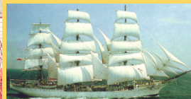
Veleiro de carga do século XIX