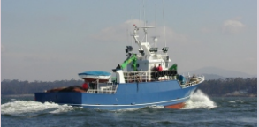
Barco do cerco