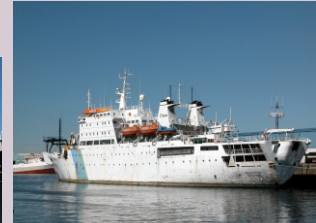
Buque de investigación