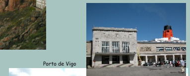
Porto de Vigo