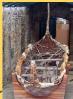
Antigo barco de coiro. Museo Arqueolóxico da Coruña.