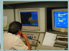
Centro de Control de Monte Enxa.