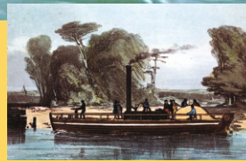
"Charlotte Dundas, barco de vapor construído en Escocia en 1801