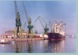
Porto de Vilagarcía