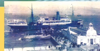
O trasatlántico "Hollandia" no porto de Vigo embarcando emigrantes para Arxentina (arredor de 1910).