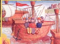
Barco medieval nun gravado da época.