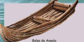
Balsa de Angola