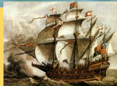
Barco e guerra inglés do século XVI