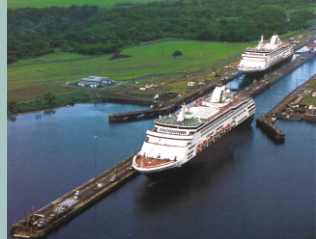
Canle de Panamá. Aberta en 1914 para comunicar os océanos Pacífico e Atlántico.

Para unha navegación eficaz son necesarias instalacións e servizos e órganos de seguimento e control