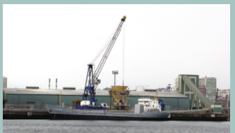
Porto da Coruña.