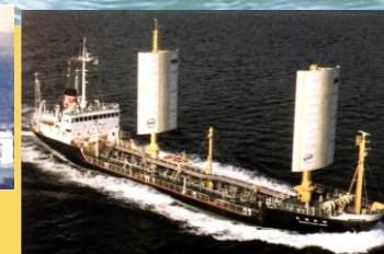
Petroleira asistido por velas. Construído en Xapón en 1980