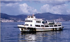
Barco de pasaxe