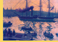
"Savannah", primeiro vapor que cruzou o Atlántico en 1819.