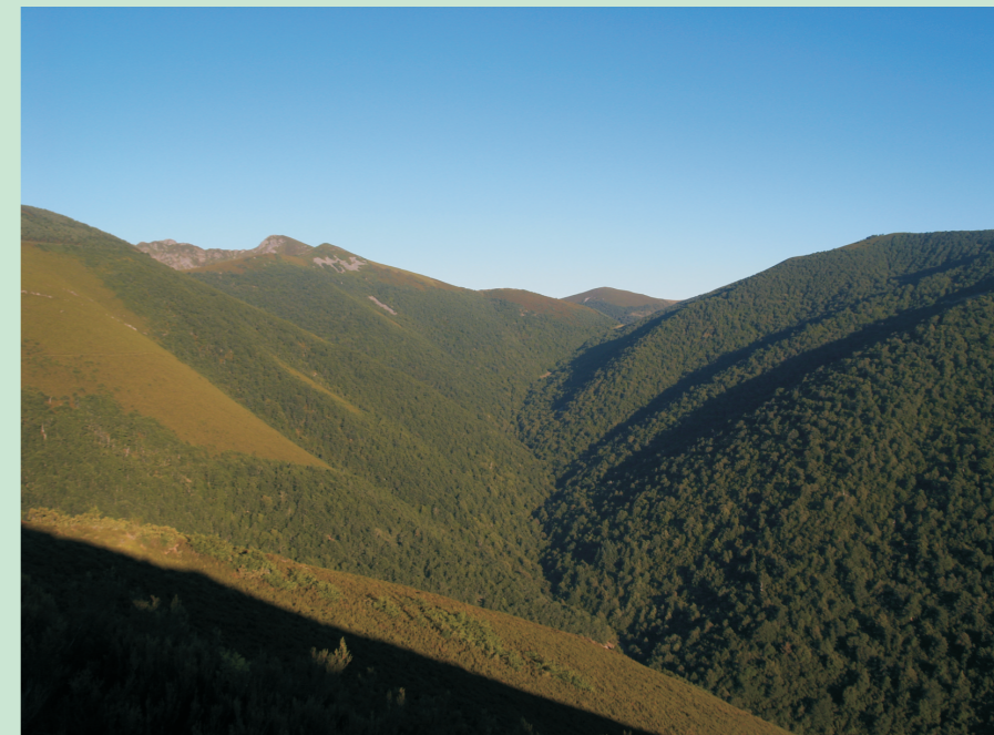
Fraga do Rego da Bara. Serra dos Ancares.