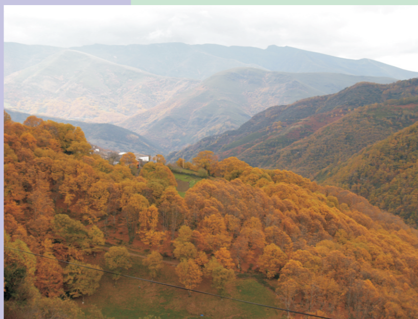
Souto no Courel. Os castiñeiros cultívanse para aproveitar castañas, madeira, cogomelos...

Os bosques de ribeira, son formacións arbóreas asociadas ao curso dos ríos. Están formadas por, amieiras, salgueiros, bidueiras, freixos, avelaneiros, sanguieiros, sabugueiros, lamigueiros, chopos... Teñen unha gran importancia ecolóxica porque regulan a temperatura e a luminosidade das augas, proporcionan refuxio e alimento á fauna, actúan como filtros verdes que limitan a chegada de contaminantes e serven de corredores para os desprazamentos dos animais.