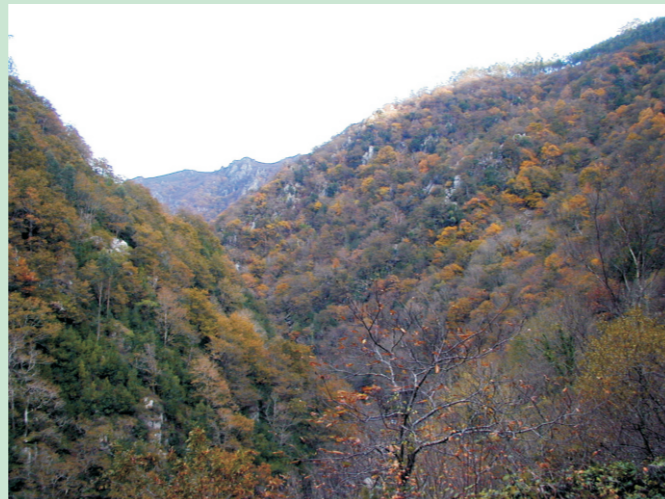
Fragas do Eume.

Carballeira do Xesta, no Suido. Os bosques reciben distintos nomes segundo as especies que dominan nel (carballeira, faial, bidueiral), ou o lugar onde se asenten (bosque de ribeira). As plantacións reciben o nome da especie dominante (piñeirais, eucaliptais, soutos...).