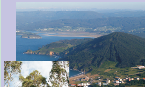
Plantacións de eucaliptos no norte de A Coruña.

O 75% do territorio forestal galego está cuberto por masas artificiais de coníferas, seguidas das frondosas autóctonas, os bosques mixtos e os eucaliptais. Galicia é a primeira reserva forestal do Estado. Calcúlase que hai máis de 688 millóns de árbores.