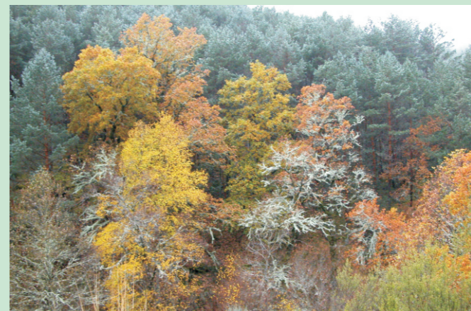
Bosque mixto no Invernadeiro.