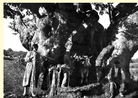
Castiñeiro de Folgueira, en Sobrado de Picato (Lugo), imaxe de 1949.

Castiñeiro de Bembibre. Viana do Bolo. Cortado hai uns 40 anos. Tiña máis de 14 m de contorno.