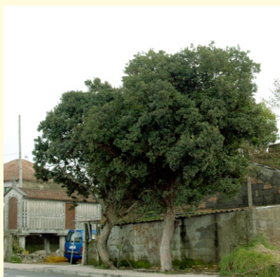
Érbedos en Ribadumia.

Os froitos son bagas esféricas de cor vermella e textura rugosa, de 2 cm de diámetro. Tardan un ano en madurar.