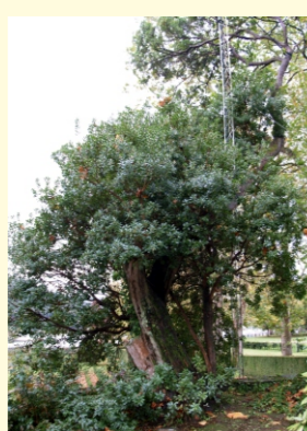
Érbedo do Pazo de Mariñán. É o máis antigo e grande de Galicia. Mide 16,50 m de altura e ten 150 anos.