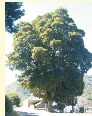
Pradairo en Vilarpandín (Navia de Suarna)