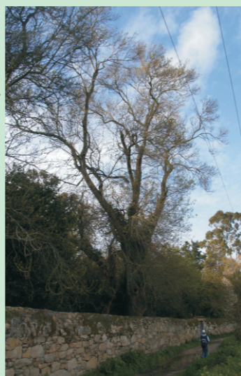
Freixo do Pazo de Fefiñáns. Mide 22 m de altura e 3,49 m de perímetro.

As flores, sen pétalos, están agrupadas en panículas que poden conter flores masculinas e femininas mesturadas ou separadas.