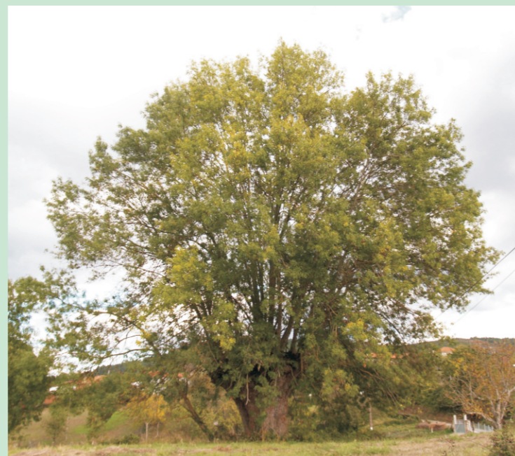
Freixo de Montepando. O Val. (As Nocedas. Monforte de Lemos). Ten máis de 250 anos e mide arredor de 18,50 m de altura e 6,50 m de perímetro.

Os froitos son sámaras, con ás de forma lanceolada de ata 5 cm de lonxitude, de cor castaña. Maduran a finais do verán.