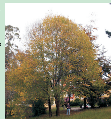
Olmo ( Ulmus hollandica ) do Pazo de Lourizán (Pontevedra). Ten máis de cen anos, mide 30 m de altura e 4,24 m de perímetro troncal.