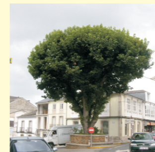
"Pravia" de Vilalba. Un pradairo que pode ter máis de 150 anos. Mide 15 m de altura e 4 m de perímetro.

As follas son caedizas, simples, opostas, palmeadas, coa beira serrada de xeito irregular. Poden medir ata 18x26 cm. O peciolo é cilíndrico, de cor encarnada de 15 cm de lonxitude. Adquiren un característica cor amarela no outono. Os froitos son secos e con ás (sámaras dobles) e están agrupados en acios pouco mestos.