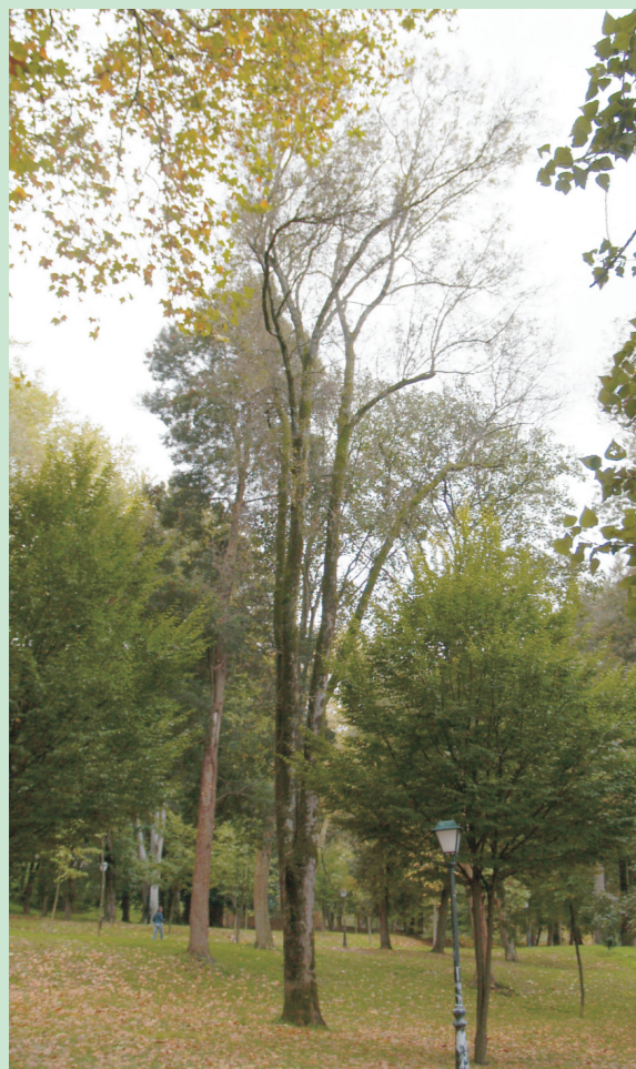
Freixo común do Parque Castrelos. Vigo. Ten máis de cen anos e arredor de 38 m de altura.

Se queres que o carro ande forte, a un tempo e velaño, bóttalle o eixo de freixo e as treitoiras de sanguíño.