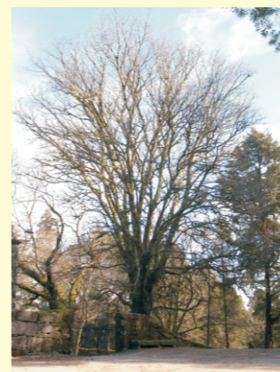
Pradairo no Monte Aloia (Tui).